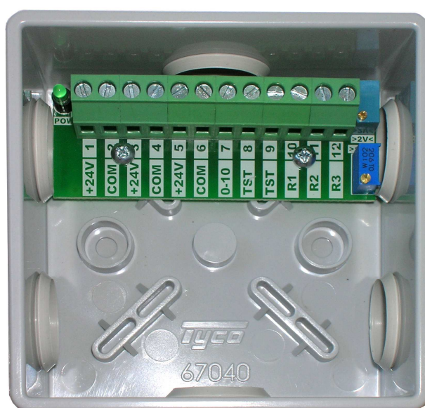
Вид со снятой крышкой